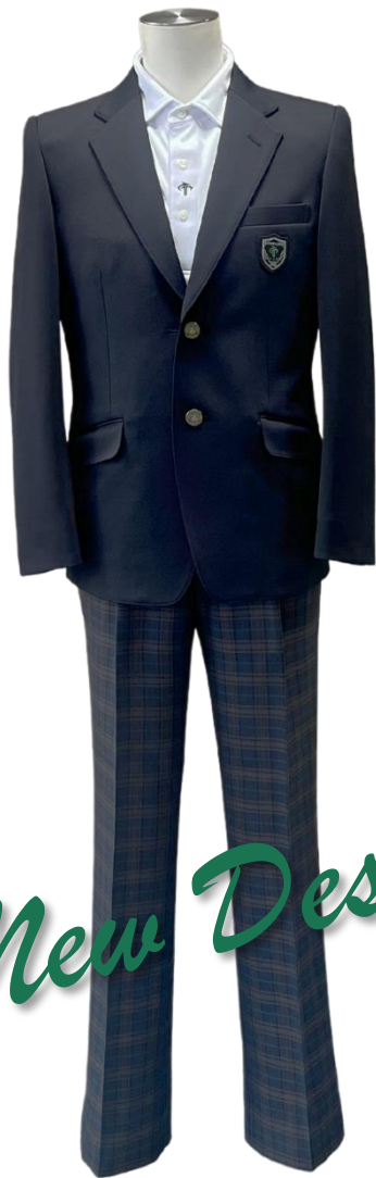
①スラックススタイル (ヒップストレート)