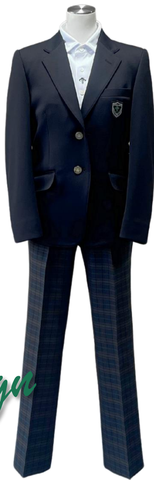
②スラックススタイル (ヒップゆったり)